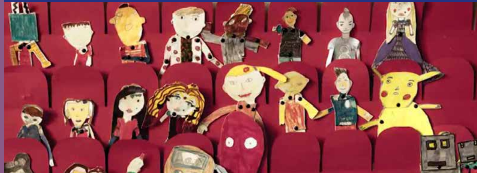
Image extraite de la bande-annonce du Festival 2016

Pendant la séance, vous êtes responsables du comportement des élèves.