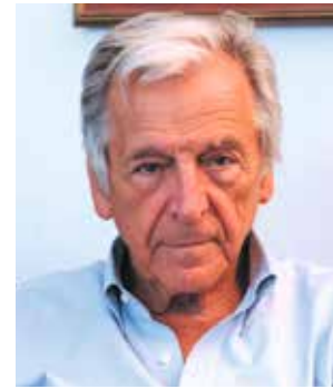
Costa-Gavras Parrain d'honneur

« Parrainer le Festival du film franco-arabe de Noisy-le-Sec, c'est lui donner ma caution, comme cinéaste et comme citoyen. Le monde arabe, cette entité plurielle, diversifiée, a besoin de nous montrer ses images, loin des préjugés et des visions médiatiques stéréotypées. Les réalisateurs ont la lucidité et le recul nécessaire pour nous offrir une vision plus « objective » de ce monde en plein changement. Notre quotidien se noie sous les informations de ce qui nous divise ; aller au Festival du film franco-arabe de Noisy-le-Sec, c'est une belle manière de voir ce qui nous unit. »