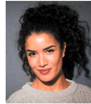
Sabrina Ouazani Marraine

« Parrainer le Festival du film franco-arabe de Noisy-le-Sec, c'est lui donner ma caution, comme cinéaste et comme citoyen. Le monde arabe, cette entité plurielle, diversifiée, a besoin de nous montrer ses images, loin des préjugés et des visions médiatiques stéréotypées. Les réalisateurs ont la lucidité et le recul nécessaire pour nous offrir une vision plus « objective » de ce monde en plein changement. Notre quotidien se noie sous les informations de ce qui nous divise ; aller au Festival du film franco-arabe de Noisy-le-Sec, c'est une belle manière de voir ce qui nous unit. »