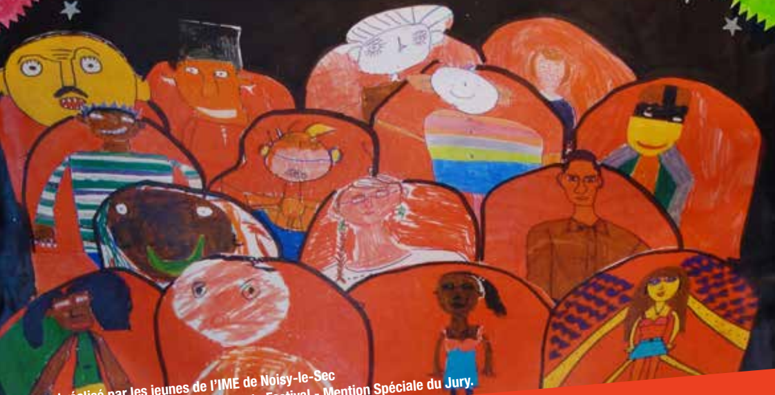
Visuel réalisé par les jeunes de l'IME de Noisy-le-Sec dans le cadre du Concours d'affiches du Festival - Mention Spéciale du Jury.